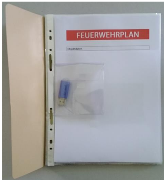
Ösenhefter, Ansicht aufgeschlagen (mit UBS-Stick in Hülle zum einheften, auch als CD-ROM in Hülle möglich)