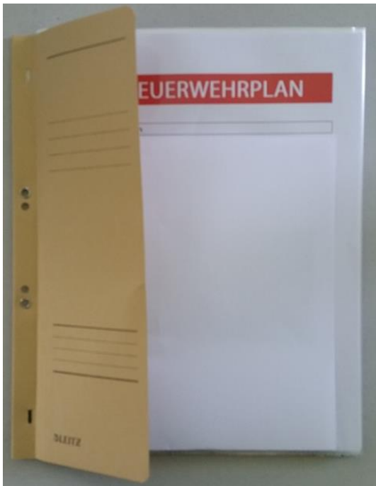
Ösenhefter, Ansicht geschlossen